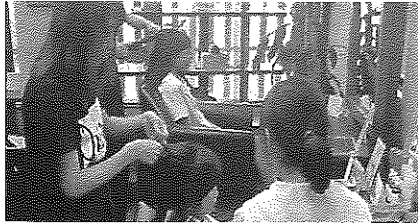
(理容店) プロってすごいなあ