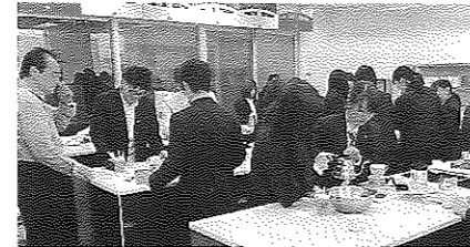
(喫茶飲食) コーヒーは奥が深い