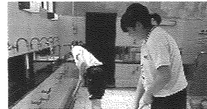
(公衆浴場) 暑い中、仕事たいへん