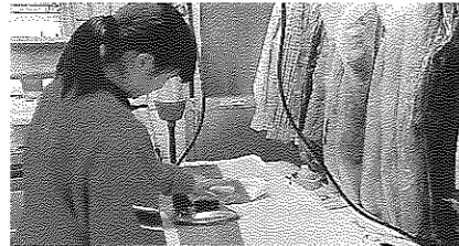
(クリーニング店) 仕事はデキパキと