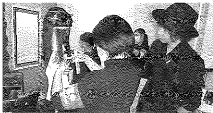
(美容店) 将来美容師になりたい