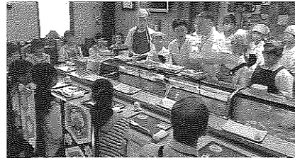
(すし店) 接客の大切さ、難しさを実感