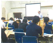
地区相談会の風景