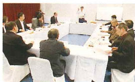
生衛役員との協議会(川内)