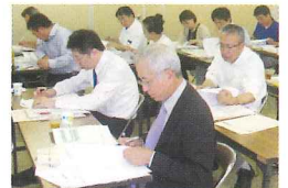
経営特別相談員研修会の風景