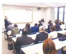
日本公庫藤山融資第二課長