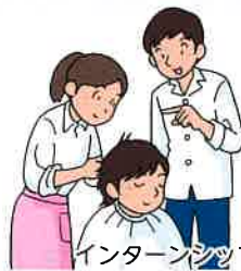
インターンシップの実施

組合を窓口とした日本政策金融公庫の低金利・長期返済の融資により経営の安定を支援しています。