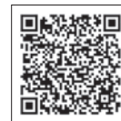
インターネット申込はこちら